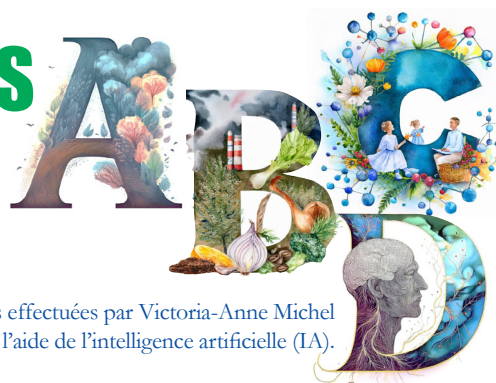
Illustrations effectuées par Victoria-Anne Michel avec l'aide de l'intelligence artificielle (IA).