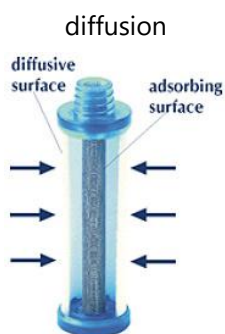
Tube 'Radiello' inséré dans une membrane de