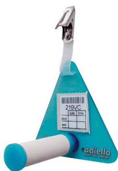
Montage sur support