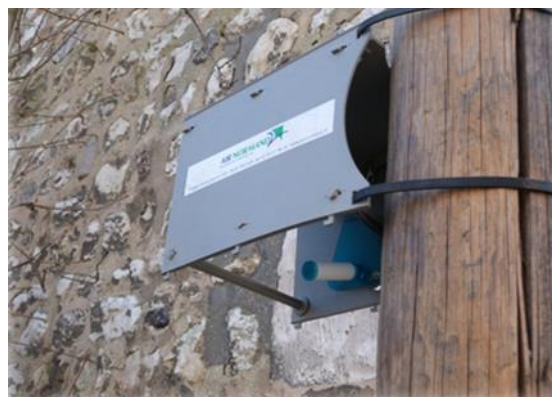
Figure 2 : Echantillonneur passif RADIELLO® avec sa membrane blanche sur support prêt à être exposé.

Les tubes passifs sont analysés par l'Institut Clinici Scientifici Maugeri (ICSM, Padoue, Italie) qui, après désorption chimique 1 , analyse les échantillons par chromatographie gazeuse couplée à de la spectrométrie de masse (GC-MS) avec une limite de quantification de 0,038 µg par tube pour le benzène.